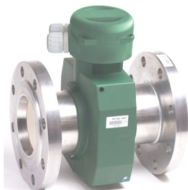
а) исполнение РС, исполнение СВ