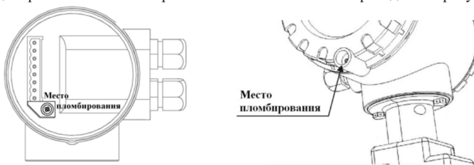
а) исполнение РС, исполнение СВ

Пломбировка расходомеров-счетчиков электромагнитных ПИТЕРФЛОУ осуществляется нанесением знака поверки давлением на специальную мастику, расположенную в чашечке винта крепления на лицевой части передней панели электронного блока и внутри электронного блока, в соответствии с рисунком 2. Схема пломбировки расходомеров-счетчиков электромагнитных ПИТЕРФЛОУ приведена на рисунке 2.