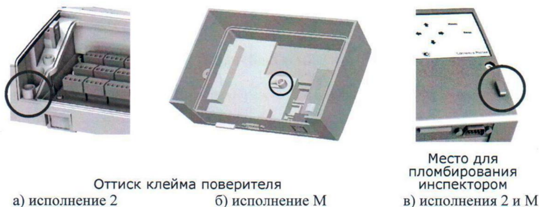
Рисунок 2 - Схема пломбировки тепловычислителя

В целях предотвращения доступа к узлам регулировки и настройки, а также к элементам конструкции предусмотрены места нанесения знака поверки - оттиска клейма поверителя на специальной мастике, расположенной в чашечке винта крепления по рисунку 2.